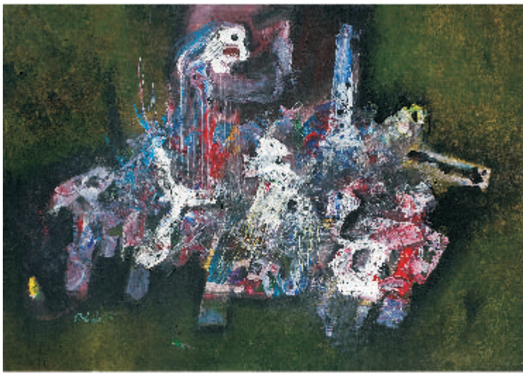
"Habitantes del silencio", 2000