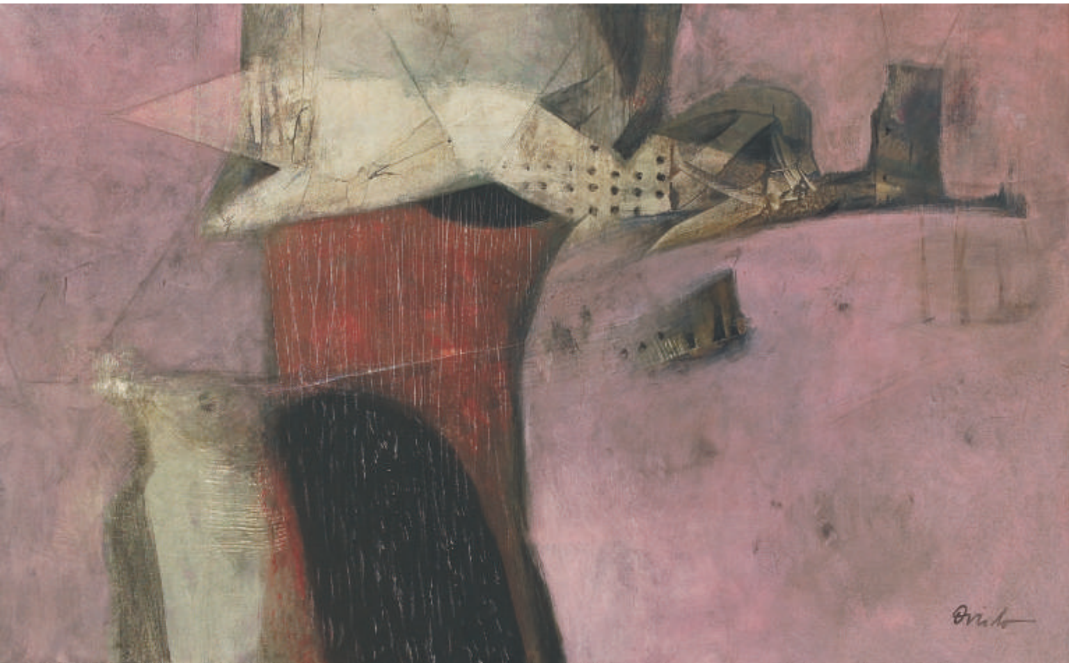
"Hito en el camino sin tiempo", 2004