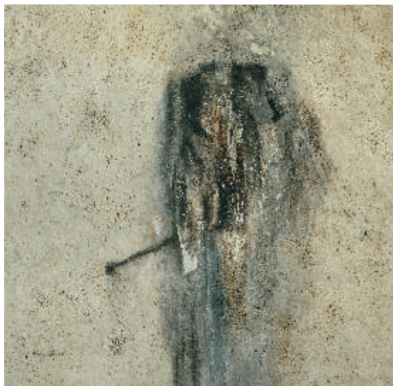
"Desgaste de un prepotente", 2002

Ahora bien, es el extraordinario dominio técnico, la extraordinaria habilidad del creador, que le permite esa libertad total. Él juega con las disonancias y la cacofonía, la espontaneidad y el gesto, la provocación y los disturbios. Pero esas energías aparentemente desbocadas culminan en el control perfecto de la buena pintura. Esto, lo logra un virtuoso del pigmento, de las mezclas, del cromatismo. De esa interpelación, mordaz, violenta aún, nacen incuestionables armonías y fuentes de fruición. Ramón Oviedo ya no tiene que presentar ni representar. La obra en sí basta. Se ha adueñado del acto de pintar, orquestando valores y colores sobre la tela. No pocas veces, ante estas obras, la percepción se desorienta si buscas comprender e identificar: aquí la finalidad es la pintura. Cerramos los ojos para escuchar mejor la gran música. Miremos, nada más, esos signos oviedianos. Detengamos las semblanzas, el concepto, las definiciones, y alcanzaremos la comunicación suprema. De modo absolutamente natural, en un proceso a la vez incontinente y sigiloso, la abstracción ha llegado, despidiendo la dimensión narrativa y sustituyéndola por una desconcertante y fascinante sintaxis visual. Asistimos a un estado de inspiración y consciencia, a un mecanismo a la vez intuitivo y voluntario. Se acabaron para Oviedo la resistencia y los constreñimientos autoimpuestos.