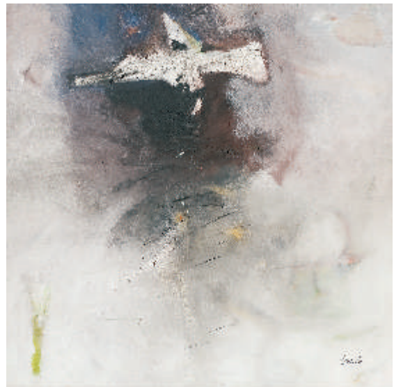
"Nave fúnebre", 2001

Para esta exhibición hemos escogido algunas de las obras maestras de esta Década , incluyendo la titulada, Persistencia de la Forma en la Materia , que fue elegida por el Diccionario