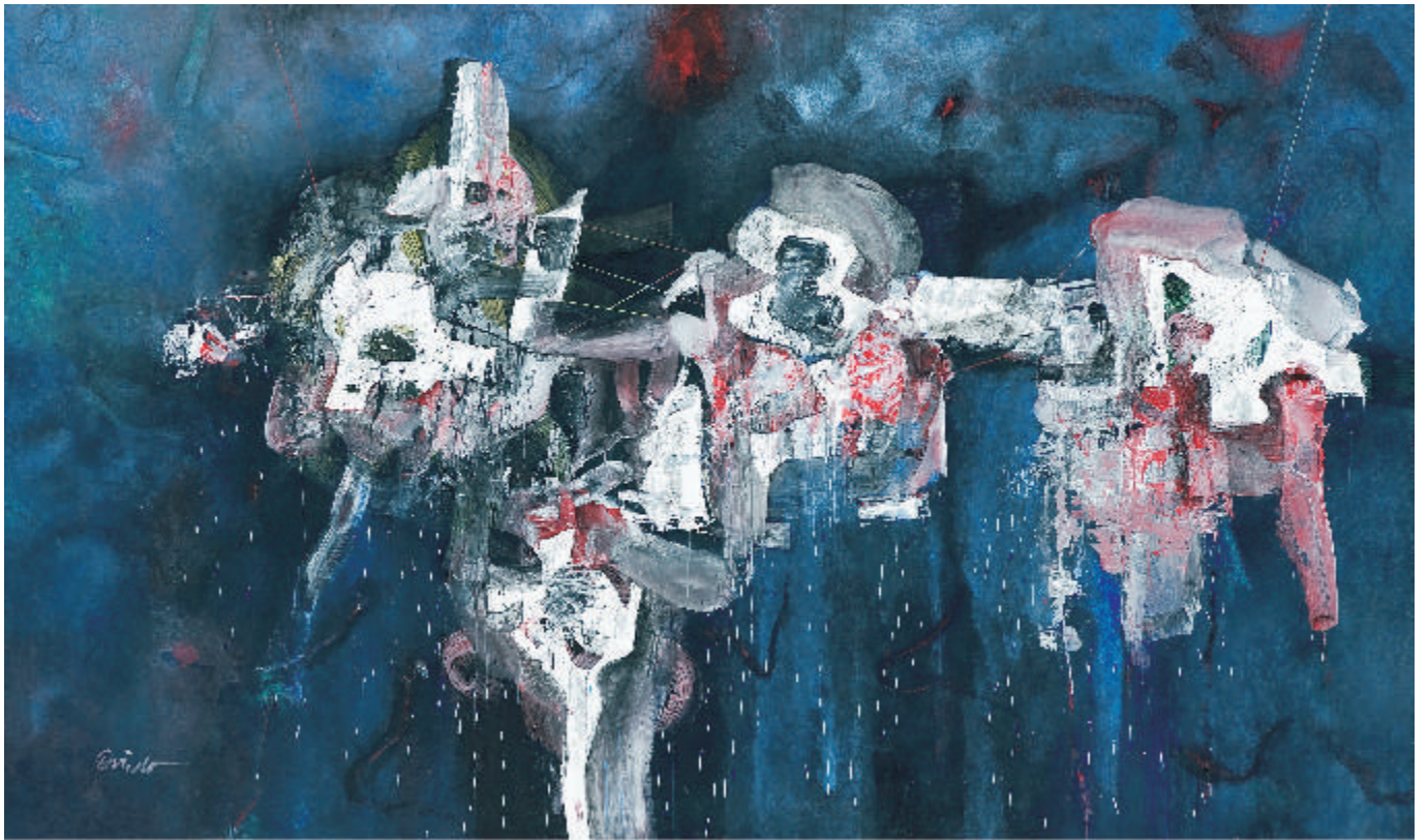
"Nubarrón nocturno", 1998

Textos: Marianne de Tolentino, Javier Arguabella, Sara Hermann, Cecilia Armitano / Diseño Gráfico: Wendy Poloney http://studiografico.blogspot.com/ / Pre-prensa e Impresión: Amigo del Hogar