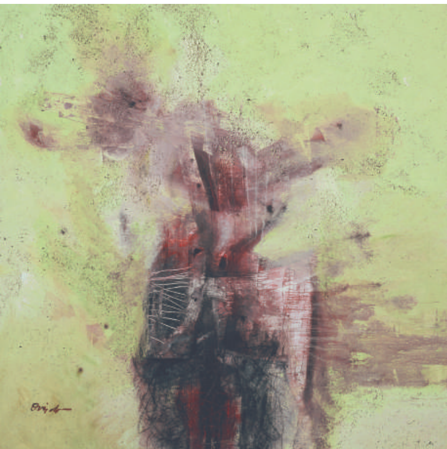
"Heridas indelebles", 2003