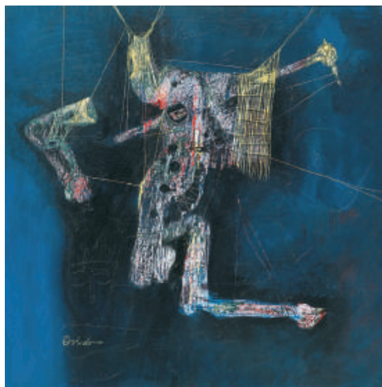
"Restos de un primario", 1997

Repito que es una labor pendiente, que nos incumbe a todos, el aposentarle firmemente en el arte global occidental como referencia de esa vitalidad americana, de ese modo de hacer tan poderoso que a veces despierta tanto entusiasmo y sorpresa como recelo y, por qué no decirlo, mal disimulada envidia ante su vigencia. Hay que procurar, y permítaseme la imagen, que Oviedo sea un objeto de deseo para museólogos, historiadores, críticos, coleccionistas y galeristas, tanto en éste como en aquel lado del Atlántico y más allá.