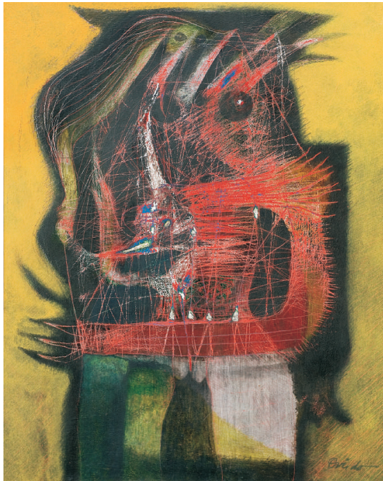
"Forma milenaria", 1998

Cuando concebimos el proyecto de conmemorar esta importante fecha, pensamos que la misma merecía presentar al público una exhibición trascendental de sus obras, por tal motivo consideramos seleccionar piezas contundentes de esta importante colección de obras, muchas de ellas desconocidas hasta ahora por el público.