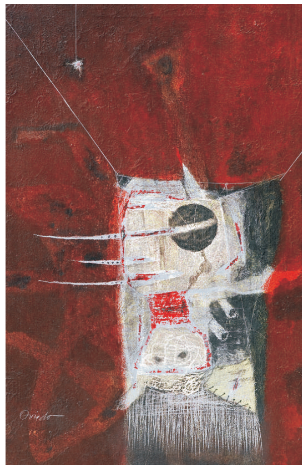
"Forma de percusión", 1997